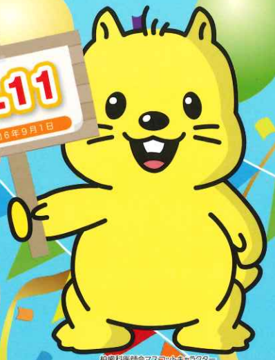
柏歯科医師会マスコットキャラクター ラッキーくん